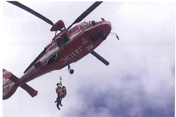
広域搬送／航空機による傷病者搬送など