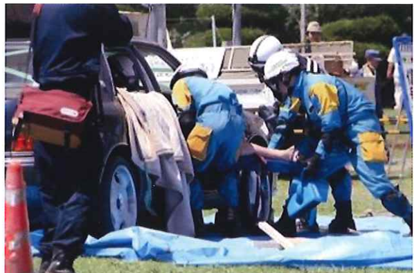
救出救助／被災車両からの人命救助など