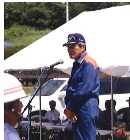
石橋消防協会会長挨拶