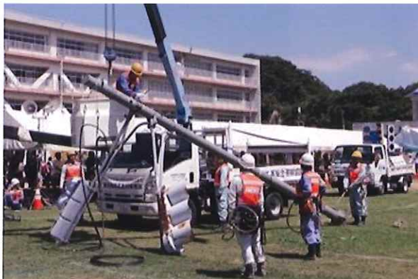
道路啓開／倒壊信号機の除去など