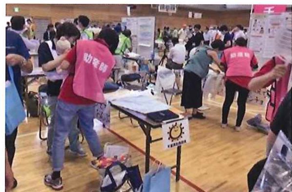
防災フェア／防災体験・教育・啓発など