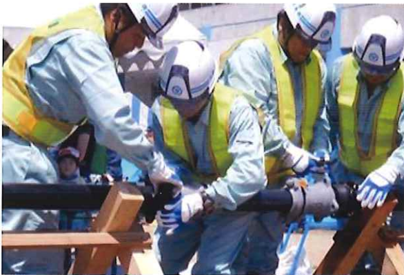
応急復旧／ライフラインの復旧など