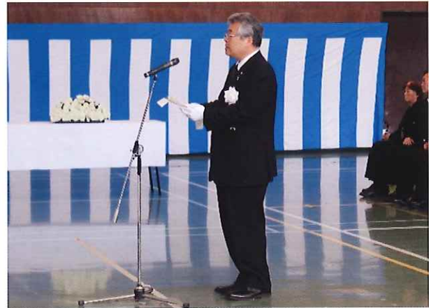
吉本県議会議長の追悼のことば