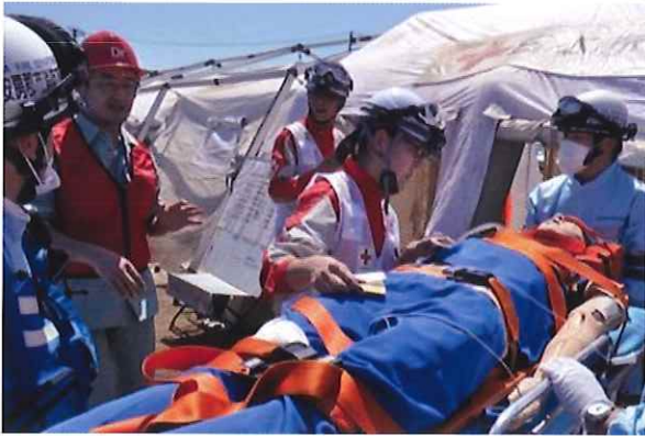
医療救護／傷病者のトリアージ活動など