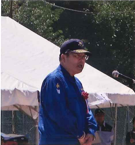
吉本県議会議長挨拶