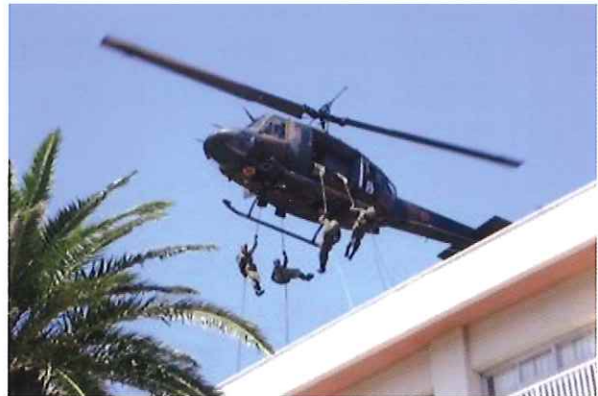
初動活動／建物内への進入捜索など