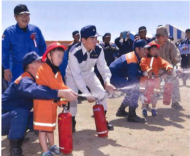
住民との初期消火体験を行う森田知事ほか