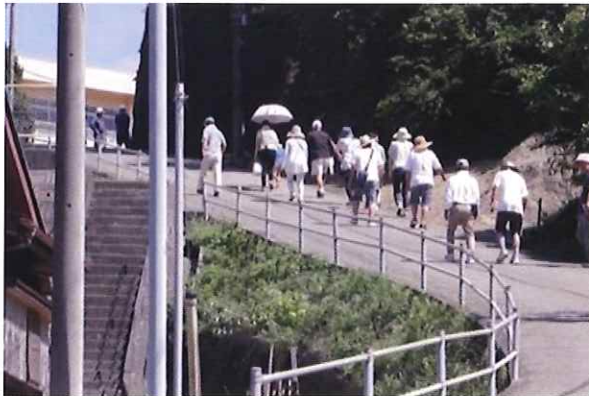
避難行動／地震発生時の津波避難など