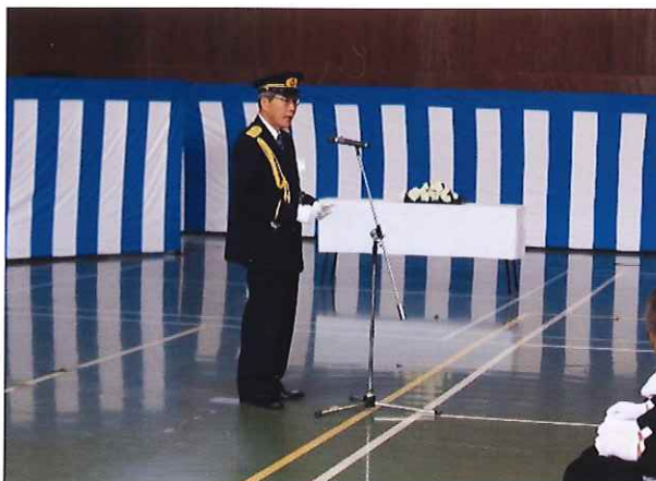
お礼のことば (石橋協会長)