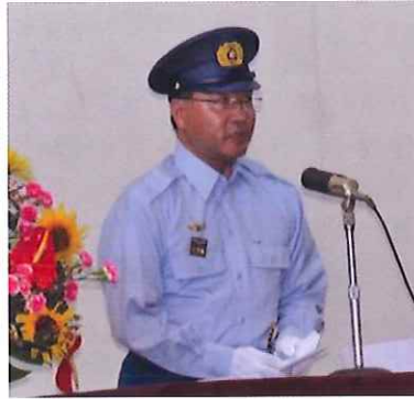
知事(石川防災危機管理部長)祝辞