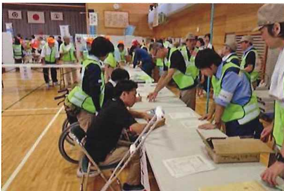
避難所運営／自主防災組織による運営など