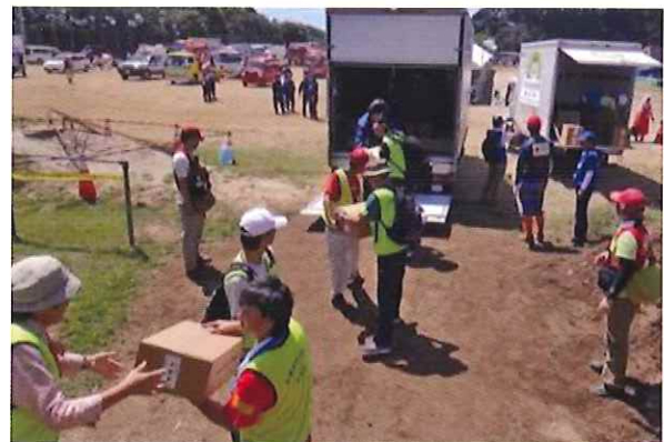
生活支援／救援物資の輸送など