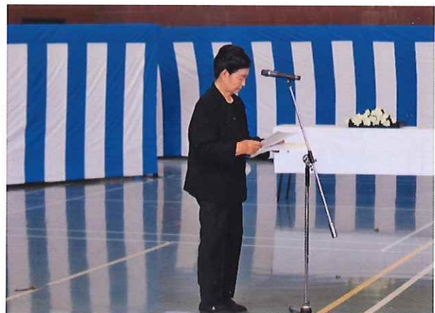
お礼のことば (山田遺族代表)