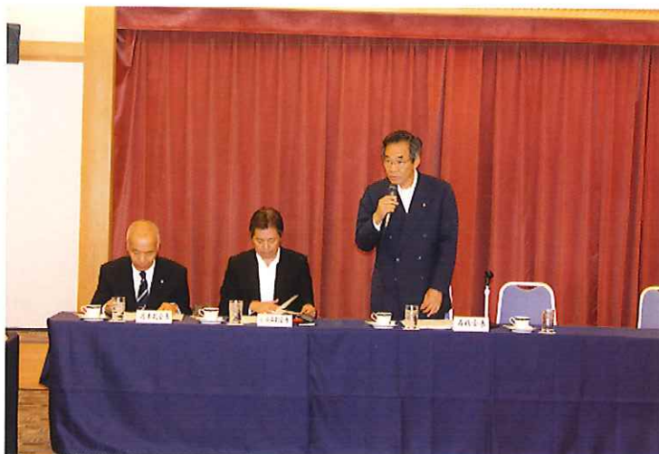
定時理事会（石橋会長挨拶）

再開後、顧問の推薦、平成28年度事業報告及び収支決算の承認、定時評議員会の開催など6議案が原案通り決議されました。