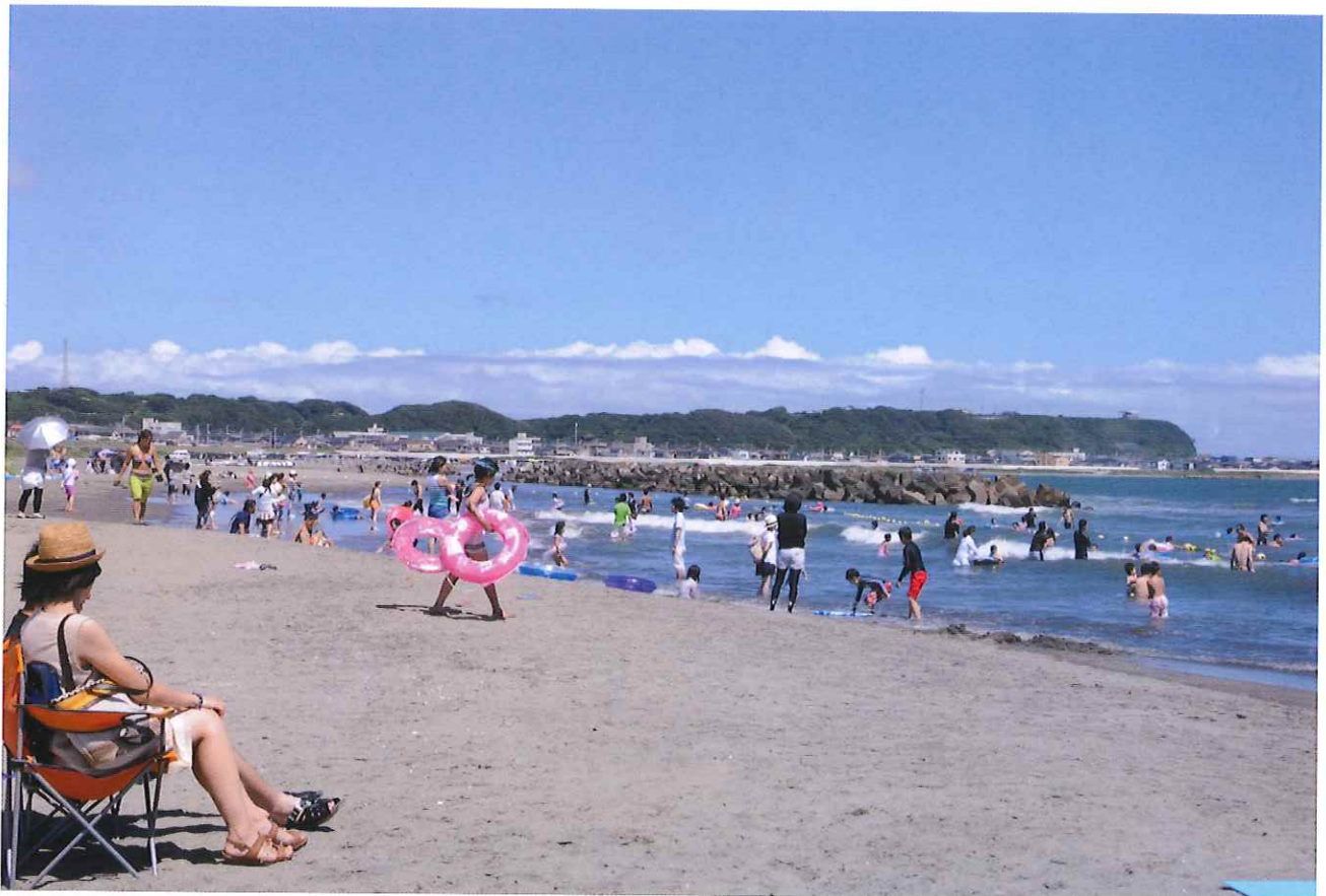
飯岡海水浴場（旭市）海匠支部

平成 29 年 7 月 1 日 編集兼発行人 千葉市中央区仁戸名町666番地2 千葉県消防会館内 公益財団法人千葉県消防協会会長 石橋 毅 TEL043(263)9885 郵便番号 260-0801 ホームページ http://business4.plala.or.jp/chisyo/ メールアドレス chisyokai@bz04.plala.or.jp