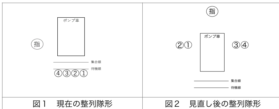
図1 現在の整列隊形