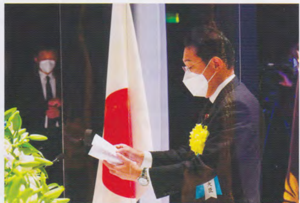
岸田内閣総理大臣の追悼のことは