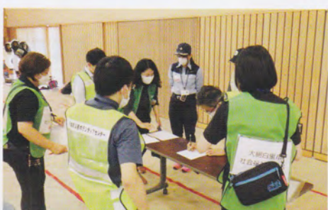
災害ボランティアセンター設置運営訓練