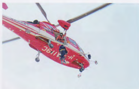
孤立避難者救助訓練