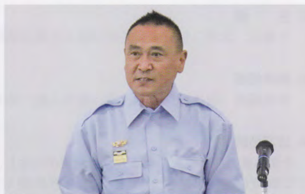
知事(代理 添谷地域防災担当部長)の祝辞