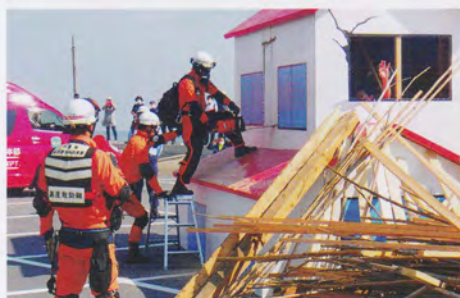
倒壊家屋からの救出救助訓練