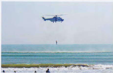
洋上救出救助訓練