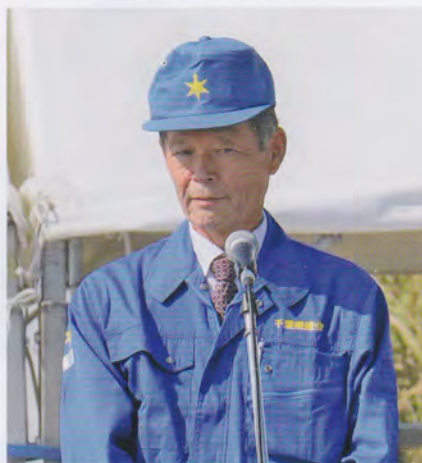
佐野県議会議長挨拶

住民は、地震の発生、津波警報の発表に伴い、内陸部への避難及び津波避難ビル、津波避難タワー、津波避難築山等の避難施設に避難を実施した。