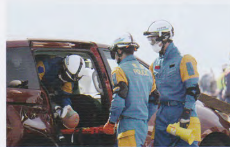
流出車両からの救出救助訓練