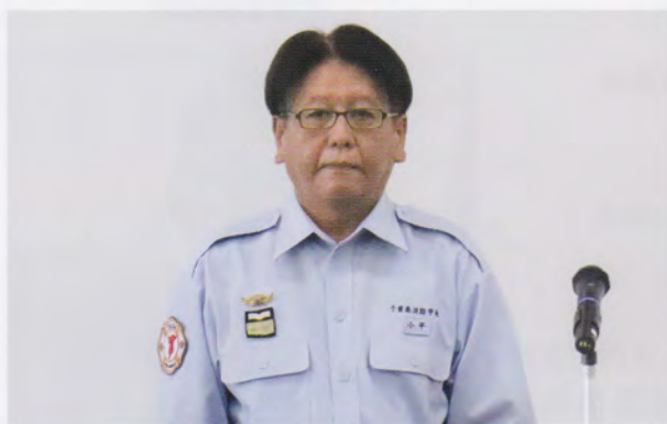
小平学校長の式辞