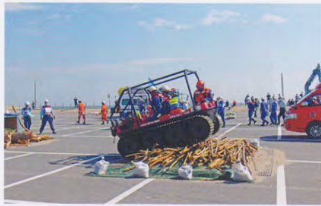
特殊車両による瓦礫走破