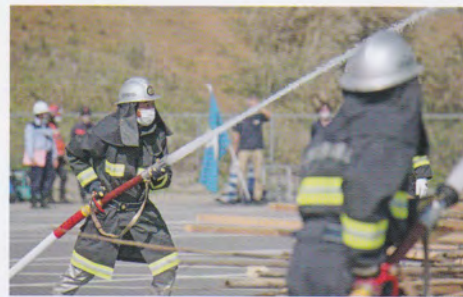
消防団による火災防御訓練