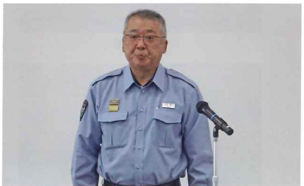
白井消防長会長祝辞