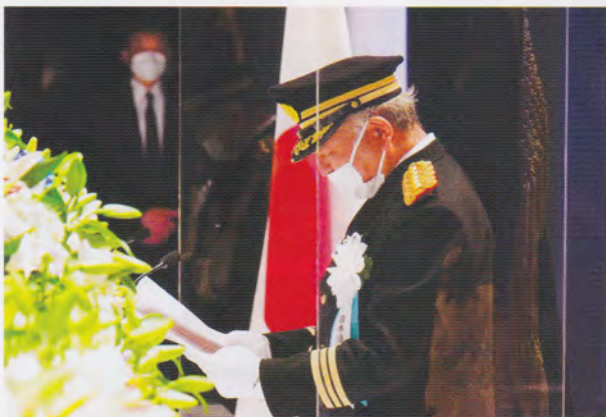
式辞を述べる秋本日本消防協会長