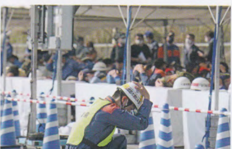
シェイクアウト訓練