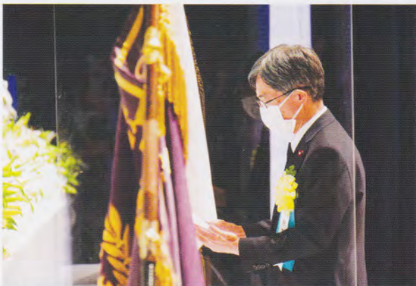
寺田総務大臣の追悼のことは