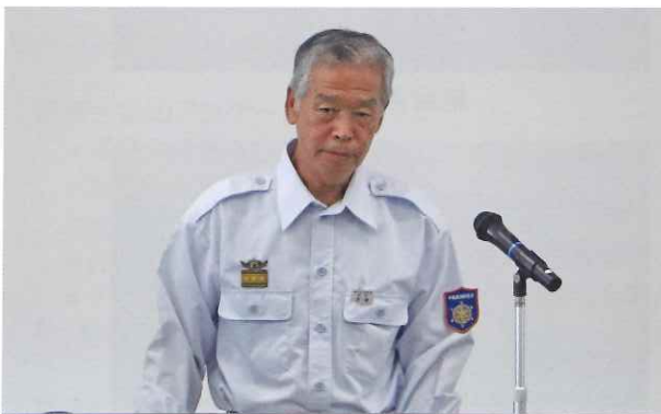
消防協会長(代理 芝岸副会長) 祝辞