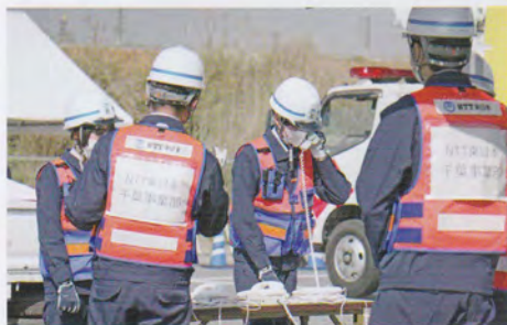
電話通信復旧訓練