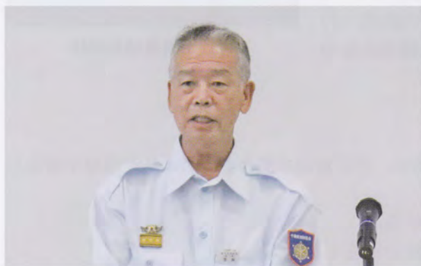
消防協会長(代理 芝岸副会長)の祝辞