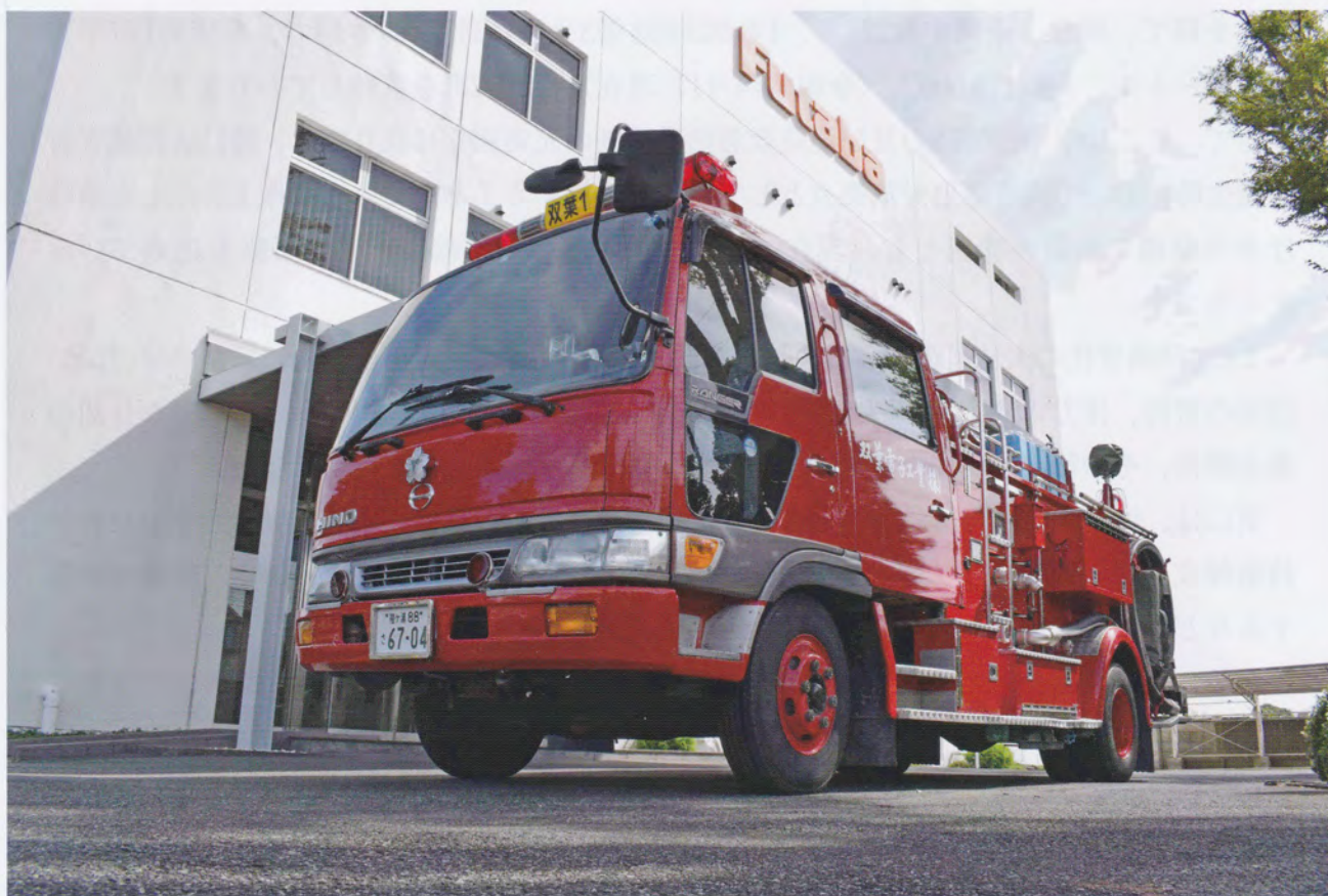
双葉電子工業株式会社 特設消防隊 (茂原市) 長生支部