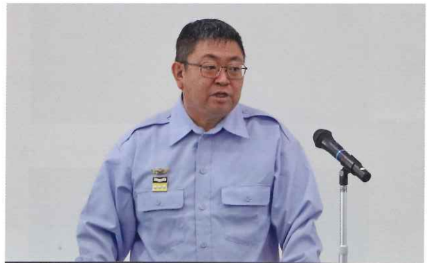
千葉県知事(代理 生稲防災危機管理部長) 祝辞