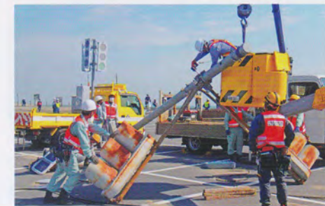
仮設信号機設置訓練