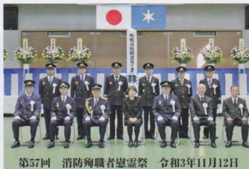
第57回 消防殉職者慰霊祭 令和3年11月12日