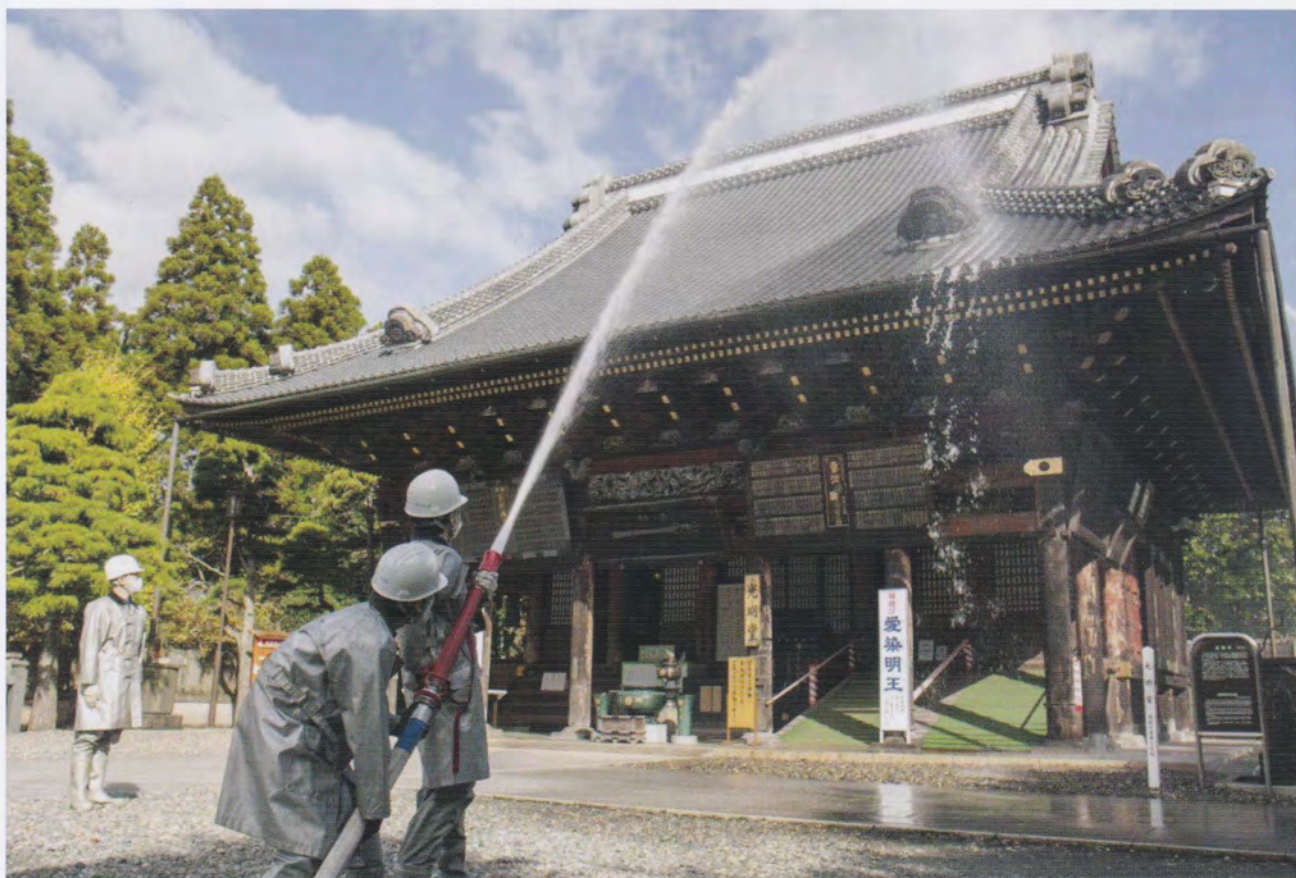
成田山新勝寺での消防訓練 (成田市) 印旛支部