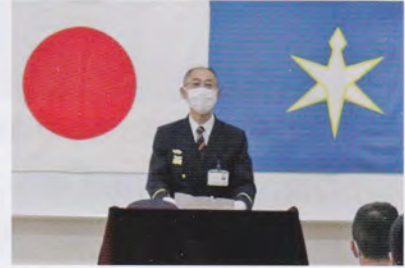
山口消防学校長挨拶