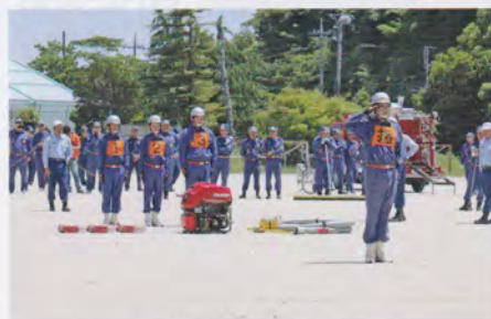
消防操法審査会の様子

また、消防団員が少しでも長く在団しても良いと思えるような方策や仕組み作りについて検討する会議を令和元年6月に立ち上げ、団員の考え方を知らすために全団員に対しアンケート調査を実施し、その結果を踏まえて会議を開催し事業の実施方法等の検討を行っているところです。しかし、新型コロナウイルス感染症の影響により役員を集めた会議が開催できない状況となったことから、zoomを利用した会議の開催法も模索しており、分団ごとの団員が不足した場合には隣接分団で柔軟的に対応できるようにするなど、団