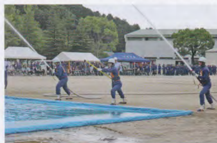
夷隅支部消防操法大会の様子

これからの消防は、消防団員と地域の方々の理解と協力により、地域が一致団結する「自助・共助」の気持ちがあれば、いつ発生するかも分からない大規模災害へ対応することはできないと考えます。今後も、消防団員一人ひとりが自らを研鑽し、資質を向上させ郷土愛護の精神で消防団員一丸となり活動していきたいと思っております。