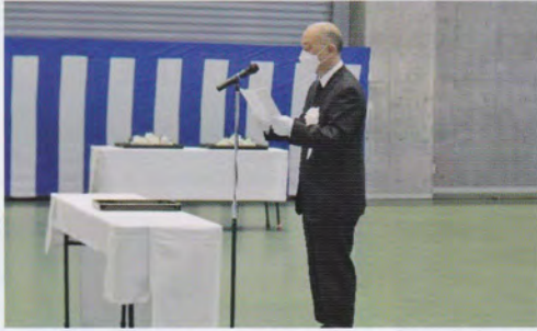
宇井千葉県市長会理事の追悼のことば