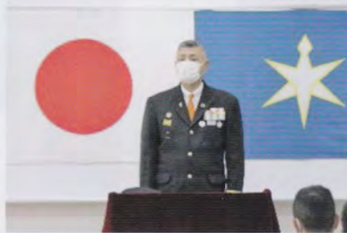
吉野館山市消防団長挨拶