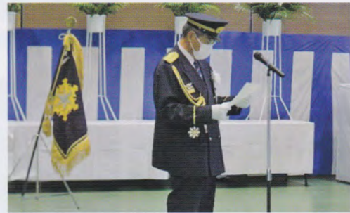
お礼のことば（石橋協会長）