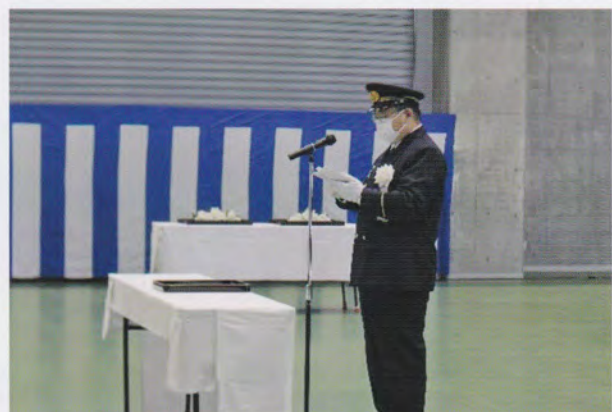
生稲防災危機管理部長の追悼のことば