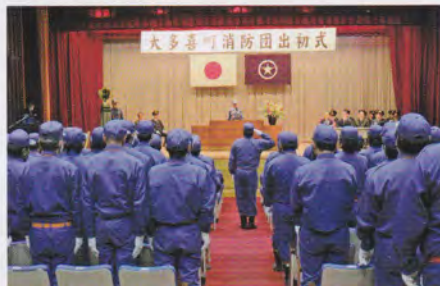
消防団出初式の様子

本町は少子高齢化が進み、消防団ではサラリーマン団員及び町外勤務者の増加、地域住民の消防団への理解の希薄化など様々な状況により地域防災の担い手である消防団員の確保が年々難しくなっています。このような中、消防団員確保の方策の一つとして、消防団員の小学校の運動会への参加や地域の方々や子供たちに消防団活動を理解していただくとともに、身近なものとして感じていただき、将来一人でも多くの方に入団していただけるよう啓発活動を実施し、入団促進を図っています。