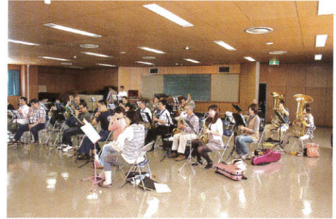
(和やかな雰囲気練習をする市民音楽隊員)

練習初日では皆さん固い表情ではありましたが、時間が経つにつれ、同じ楽器の隊員や席がとなり同士での会話が弾むなど和やかな雰囲気の中、船橋市消防局音楽隊の新たな一步が踏み出せました。