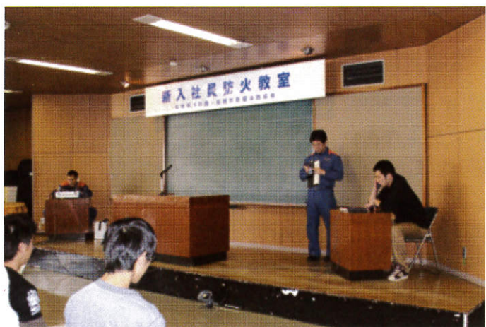
通報訓練を体験する新入社員

通報訓練を体験した新入社員からは、「慌ててしまい会社の住所が言えなかった」と訓練の重要性を深く認識しておりました。