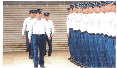
(職員の規律を再確認する消防局長)

毎年、新年度に中央消防署、東消防署、北消防署において、全署員に対し署長点検を行っているところですが、さらなる服務規律の保持を図り、職員の判断力・結束力・組織力をより強固にするため実施いたしました。