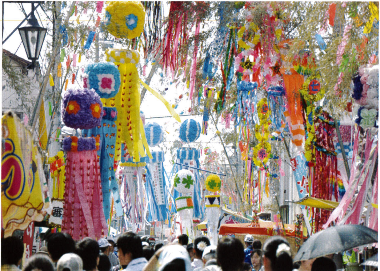
「茂原七夕まつり」茂原市(長生支部)

平成25年7月1日 編集兼発行人 千葉市中央区仁戸名町666番地2 千葉県消防会館内 公益財団法人千葉県消防協会会長 石橋 毅 TEL043(263)9885 郵便番号 260-0801 (定価50円) ホームページ http://business4.plala.or.jp/chisyo/ メールアドレス chisyokai@bz04.plala.or.jp